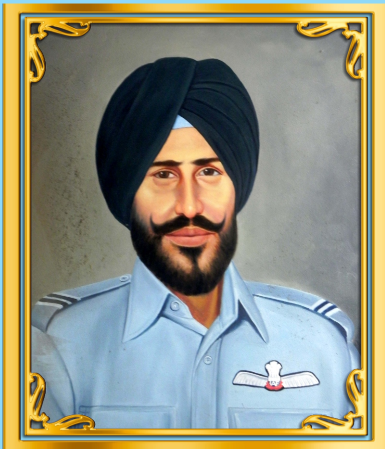
ਫਲਾਈੰਗ ਅਫ਼ਸਰ ਨਿਰਮਲਜੀਤ ਸਿੰਘ ਪਰਮਵੀਰ ਚੱਕਰ